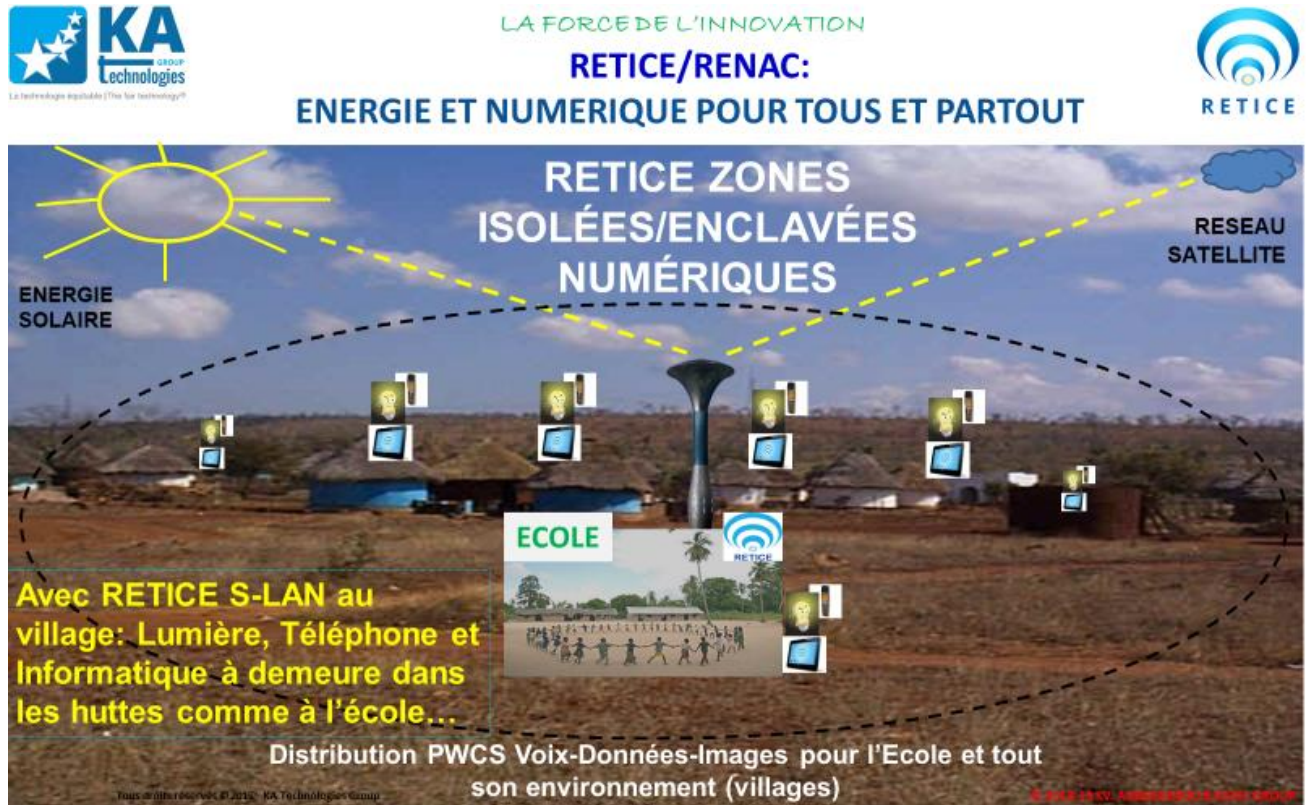
Fig. 3 RENAC : Environnement numérique étendu autonome en zone rurale