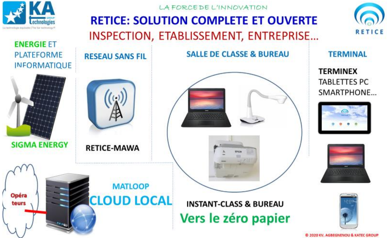
Fig.1 Vue globale de la solution RETICE pour établissement